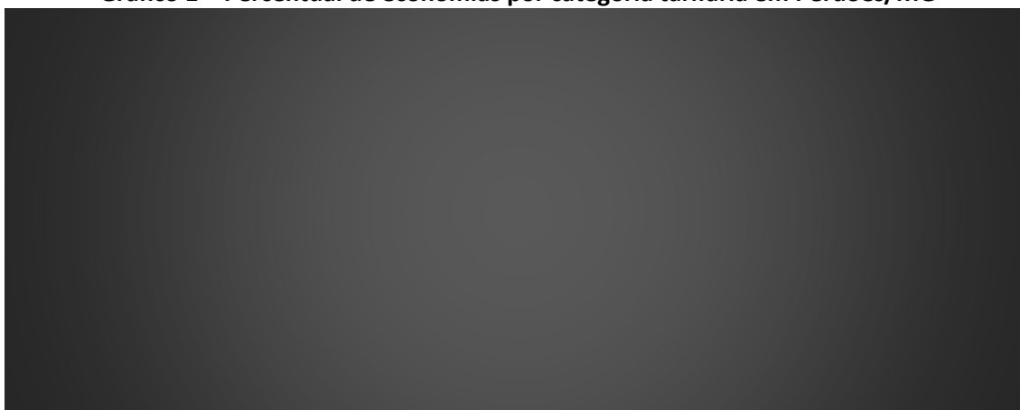
Gráfico 1 – Percentual de economias por categoria tarifária em Perdões/MG