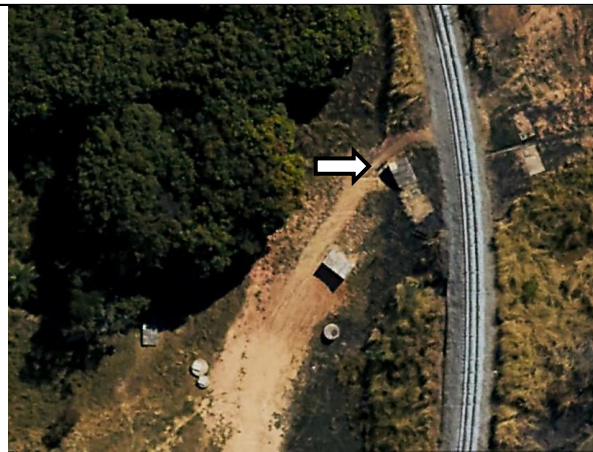
Imagem 3. Imagem de satélite do ponto do vazamento da adutora de água tratada.