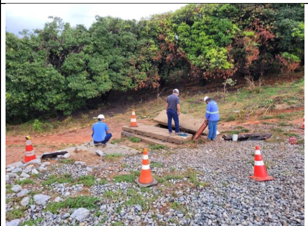
Imagem 6. Realização de manutenção no poço de vistoria do registro da adutora.