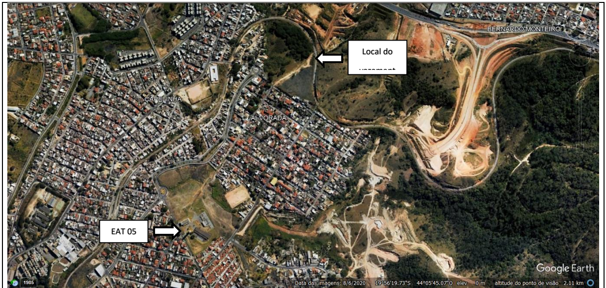
Imagem 1. Imagem de satélite do bairro alvorada, evidenciando o ponto do vazamento e a área da EAT 05.