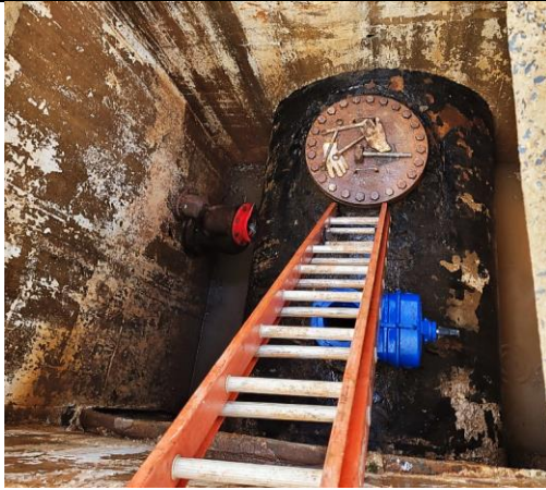
Imagem 7. Interior do poço de vistoria do registro da adutora.