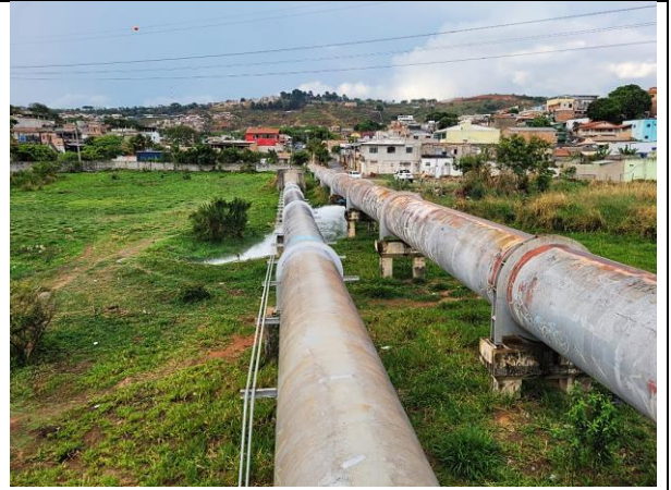
Imagem 8. Adutora de água tratada.