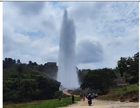
Imagem 4. Imagem fornecida pela Copasa MG da coluna d'água proveniente do vazamento.