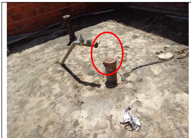
Foto 4 Poço fora de operação