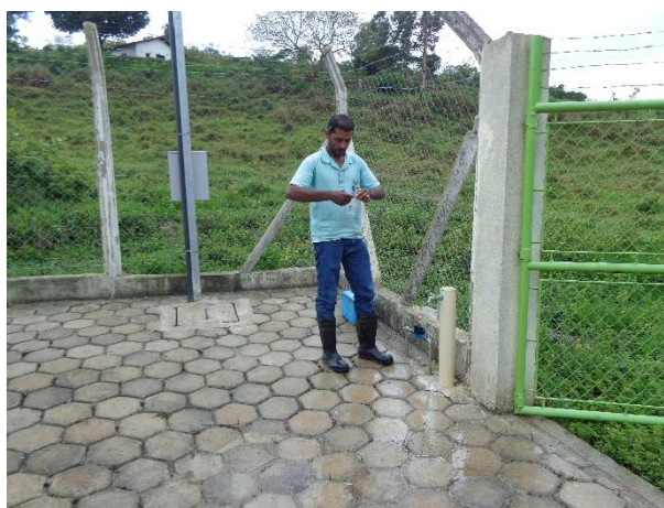
Imagem 1. Coleta de amostra de água na saída do tratamento - Poço tubular profundo - Tibuna

De acordo com o Formulário de Descrição Técnico-Operacional (Anexo II, itens 5 e 6), a captação de água bruta é realizada no poço tubular profundo C 01, cuja vazão média de operação é de 1 l/s. Segundo registrado no item 7 do anexo supracitado, a água captada é submetida ao tratamento simplificado de cloração e fluoretação. Durante a fiscalização foram realizadas coletas de amostras de água para análises dos parâmetros do padrão de potabilidade da água distribuídas ( imagem 1 ).