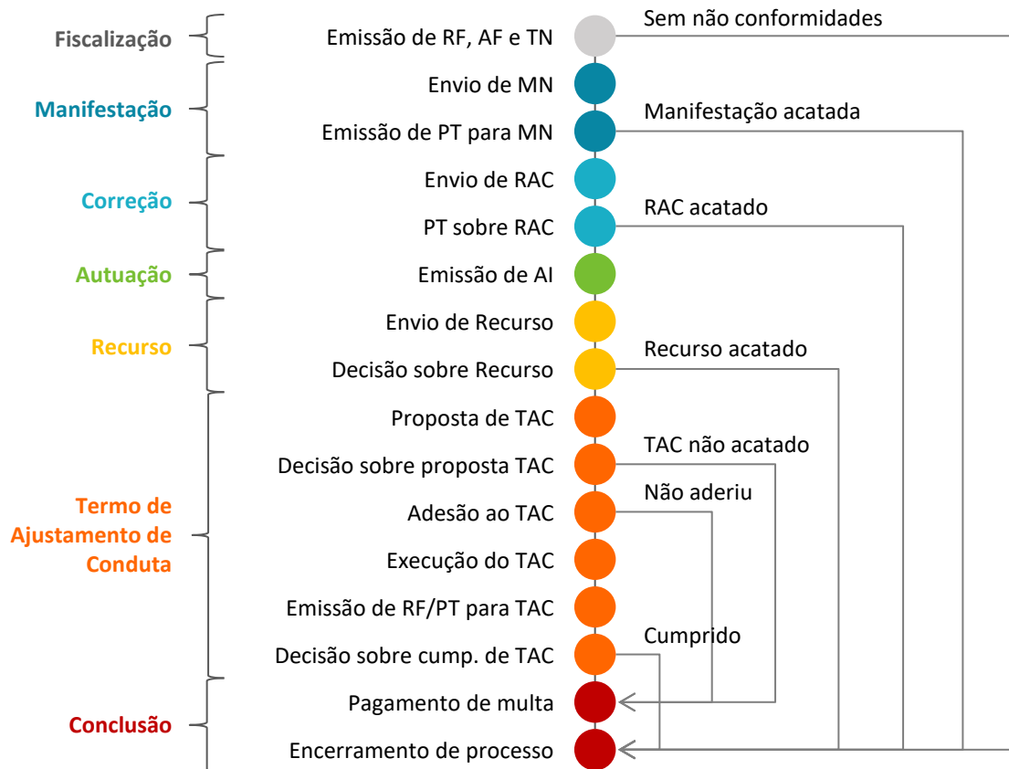
Figura 2. Resumo das principais etapas dos processos fiscalizatório, sancionatório e de TAC

Avaliado o quantitativo de constatações, as mais frequentes são relacionadas às seguintes não conformidades: NC-47: Deixar de cumprir o plano de amostragem para controle da qualidade da água (26,3%); NC-6: Deixar de cumprir os prazos para atendimento de solicitações de ligação ou de vistoria para ligação de água ou esgoto (7,6%); e NC-27: Deixar de manter placas de advertência e/ou de identificação nas unidades (6,8%). Por outro lado, foram observadas 18 não conformidades para as quais não foram registradas nenhuma constatação desde o início da tramitação de processos no SIR, sendo elas: NC-1, NC-2, NC-4, NC-5, NC-7, NC-8, NC-9, NC-11, NC-13, NC-14, NC-15, NC-22, NC-34, NC-35, NC-51, NC-52, NC-53 e NC-62. Na Figura 2 é apresentado um resumo das principais etapas do processo sancionatório.