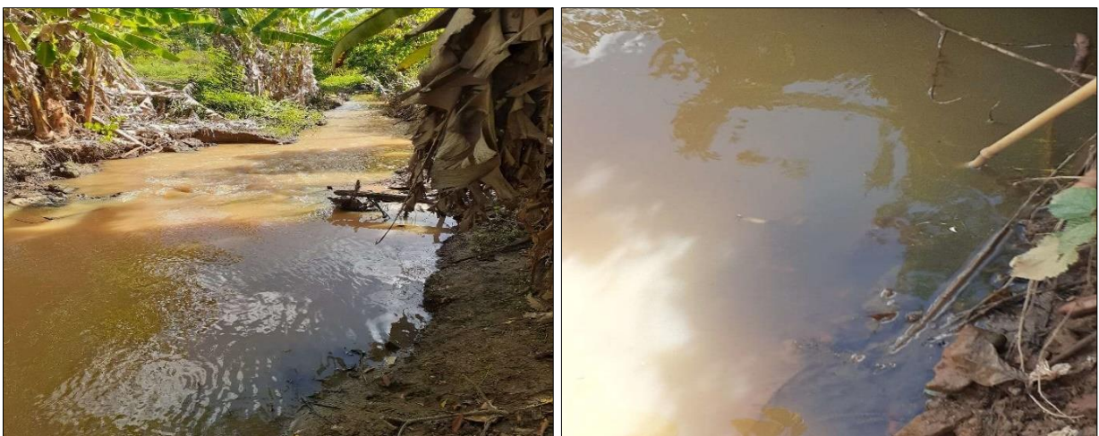
Rua Verde Minas Alves Lopes

Segundo a Copanor (Anexo II), a rede coletora de esgoto da sede municipal de Bandeira possui 9.162 metros de extensão, o que confere ao município 100% de cobertura do sistema e atende a 86,7% da população por meio de 1.227 ligações ativas. Além dessas, o sistema possui 79 ligações factíveis, que são imóveis localizados em logradouros em que há infraestrutura pública de coleta de esgoto, mas não estão conectados à rede pública.