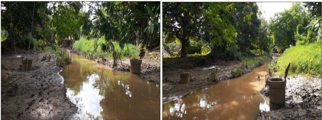
Rua Jovelino Brito Amaral

O sistema de esgotamento sanitário da sede municipal de Bandeira é constituído por rede coletora de esgotos (RCE), com a prestação do serviço de coleta, afastamento e disposição final dos esgotos. Segundo a Copanor, os pontos de lançamento do esgoto coletado estão situados na Rua Jovelino Brito Amaral (-15.886390° / -40.561269°) e na Rua Verde Minas Alves Lopes (-15.886033° / -40.557675°).