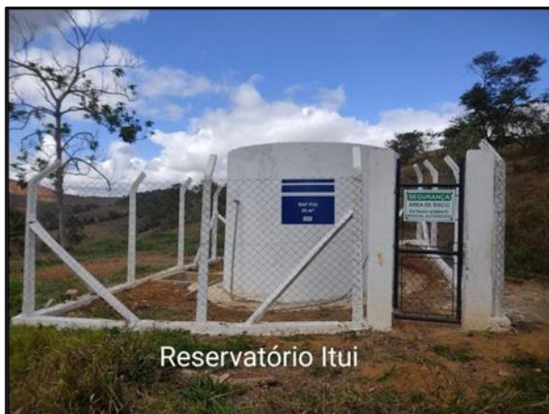
Foto 1. Reservatório Ituí

Foram analisados os registros de inspeção sanitária dos reservatórios, no período de janeiro a julho de 2021, constatando-se que não ocorreram pendências em relação à Resolução Arsaie nº 129/2019 e que se encontram devidamente trancados, em áreas protegidas do acesso de pessoas não autorizadas (Fotos 1 a 6).