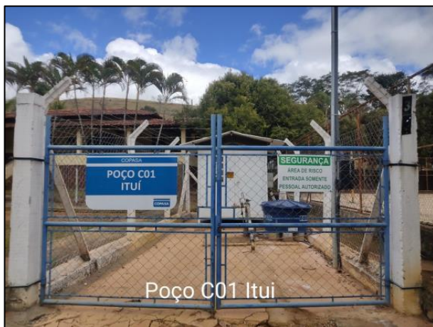
Foto 3. Poço Ituí