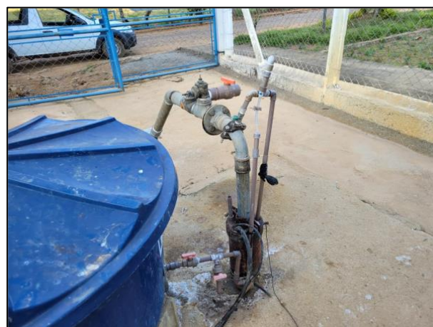
Foto 4. Poço Ituí