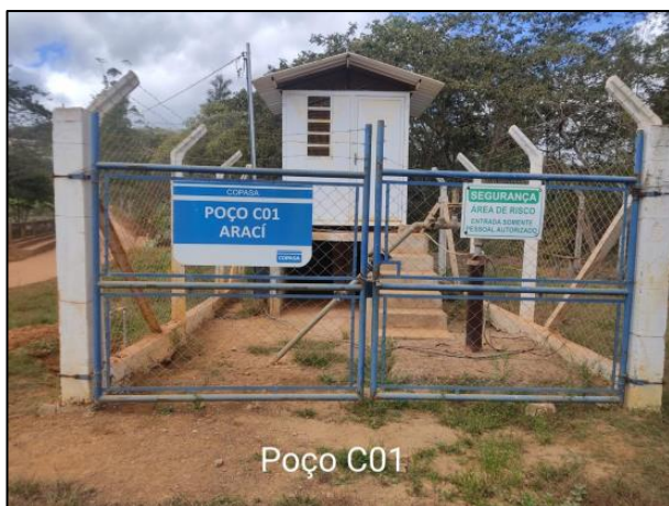
Foto 5. Poço Araci