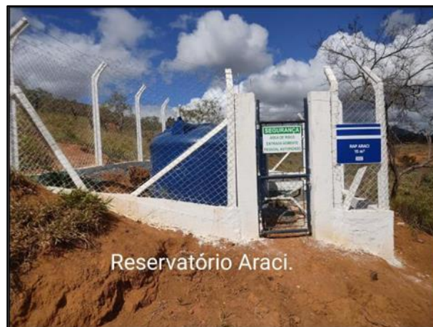
Foto 2. Reservatório Araci