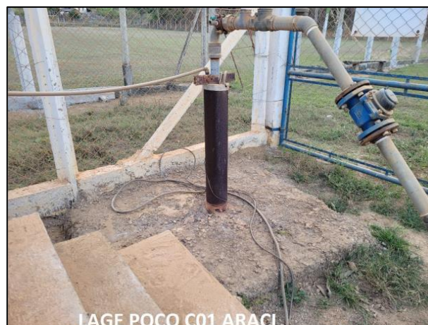
Foto 6. Poço Araci