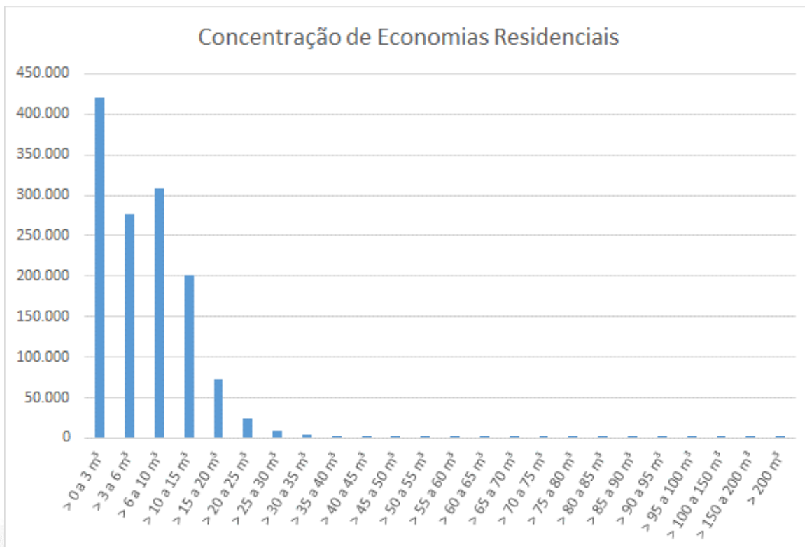
Gráficos 1: Perfil de consumo das categorias residenciais.